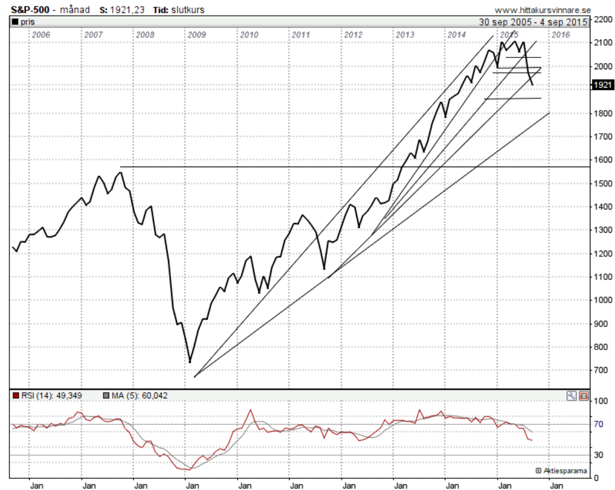
DIAGRAM över S&P 500